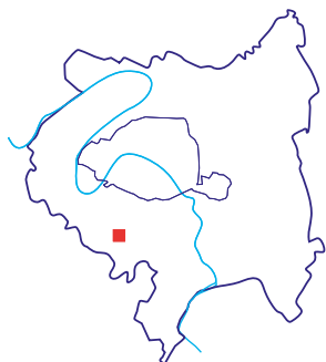
Site «Inventons la Métropole du Grand Paris», Place du Général de Gaulle et abords

Place du Général de Gaulle, 71-73 rue Houdan, rue Voltaire, 3 rue du Four 92330 Sceaux